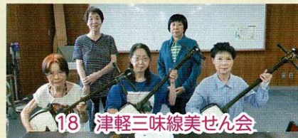
18 津軽三味線美せん会