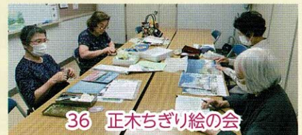
36 正木ちぎり絵の会