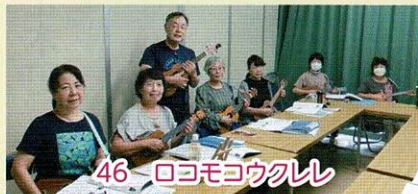
46 ロコモコウクレレ