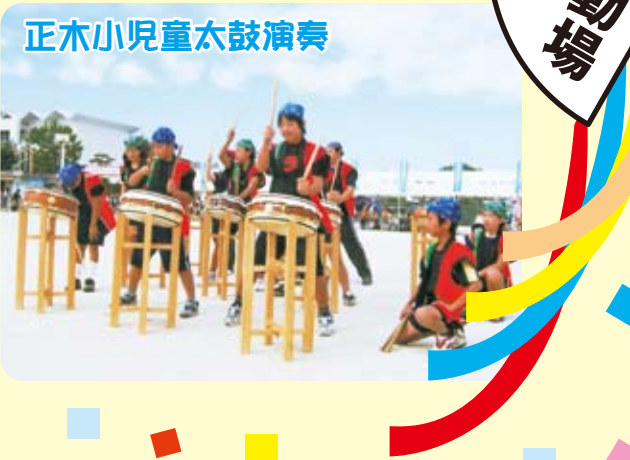
正木小児童太鼓演奏