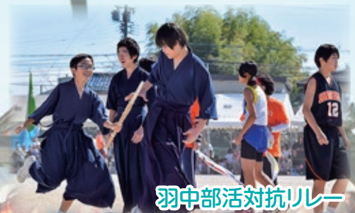
羽中部活対抗リレー